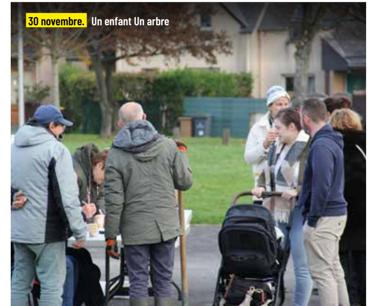
30 novembre. Un enfant Un arbre