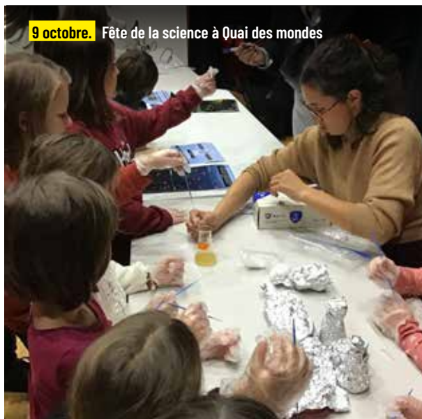
9 octobre. Fête de la science à Quai des mondes