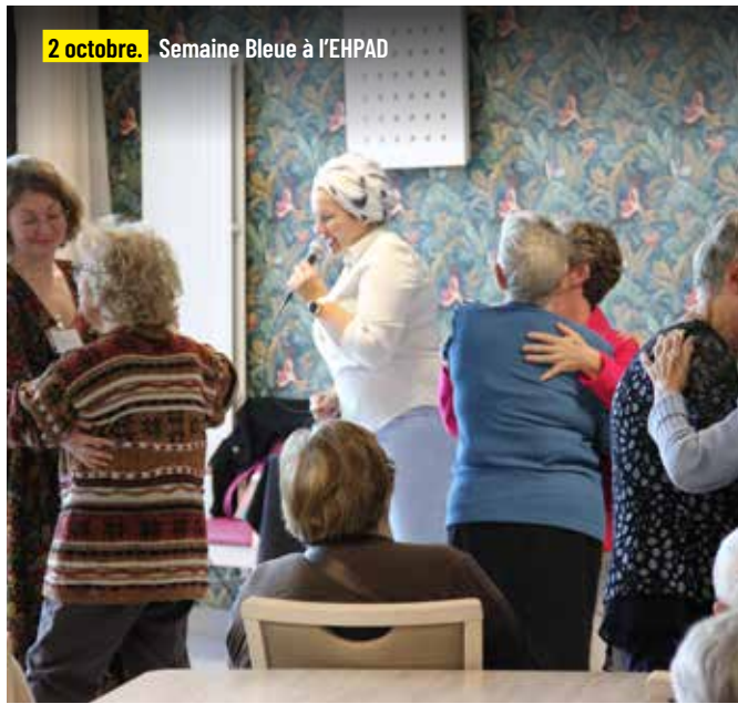
2 octobre. Semaine Bleue à l'EHPAD