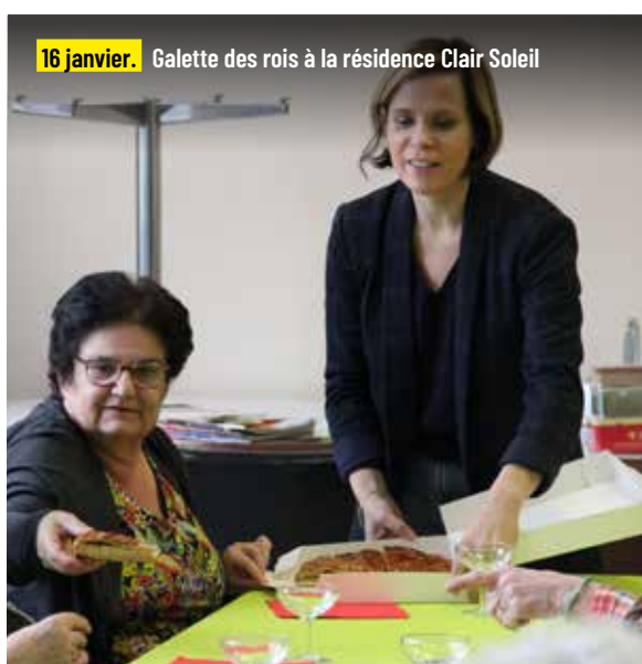
16 janvier. Galette des rois à la résidence Clair Soleil