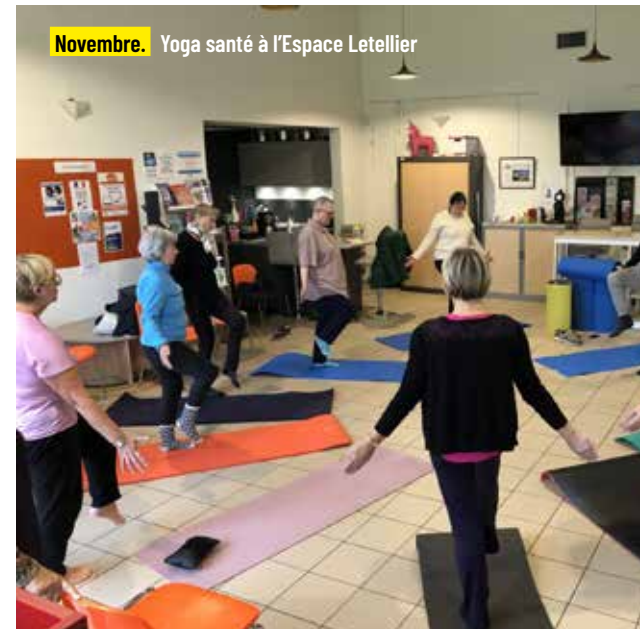
Novembre. Yoga santé à l'Espace Letellier