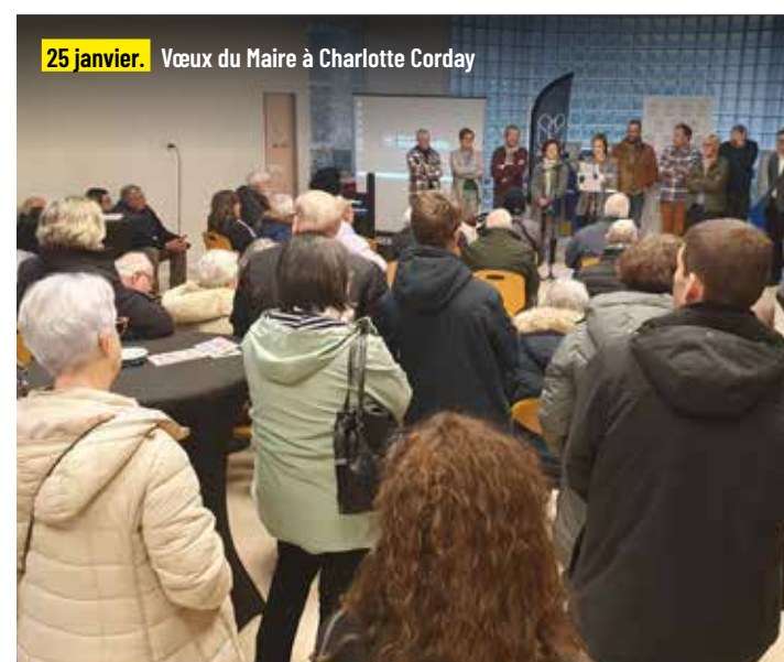
25 janvier. Vœux du Maire à Charlotte Corday