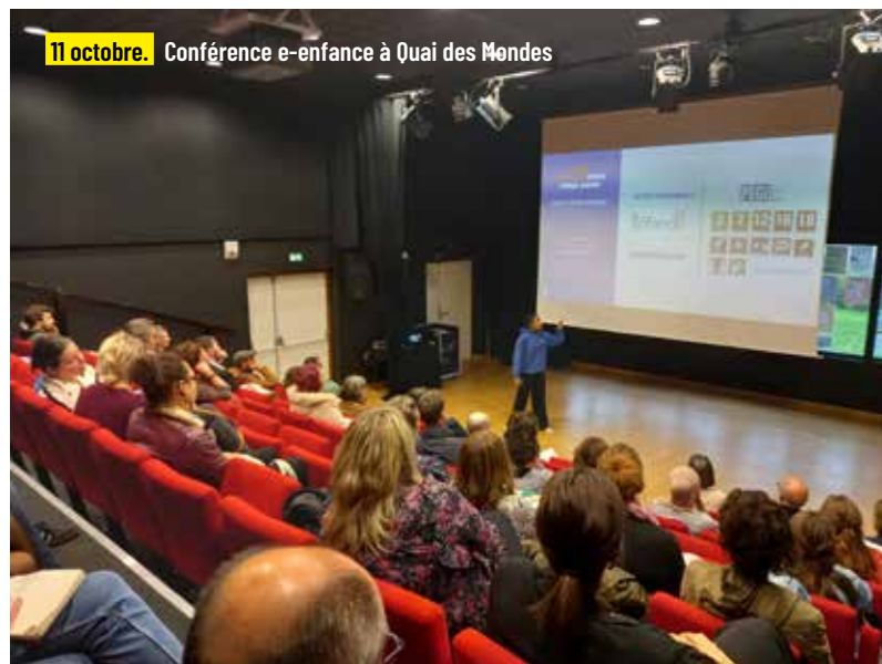
11 octobre. Conférence e-enfance à Quai des Mondes