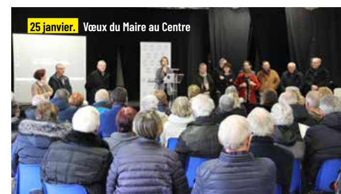
25 janvier. Vœux du Maire au Centre