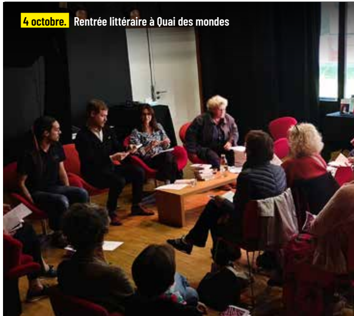
4 octobre. Rentrée littéraire à Quai des mondes