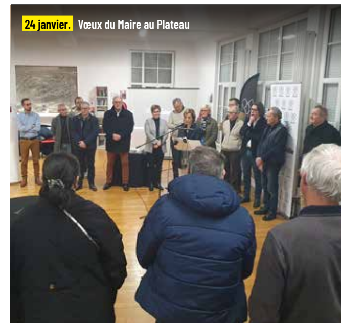
24 janvier. Vœux du Maire au Plateau