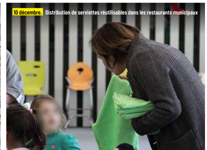
10 décembre. Distribution de serviettes réutilisables dans les restaurants municipaux