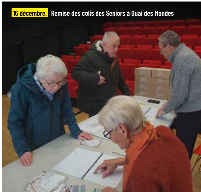
16 décembre. Remise des colis des Seniors à Quai des Mondes