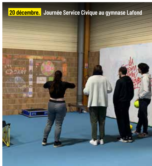
20 décembre. Journée Service Civique au gymnase Lafond