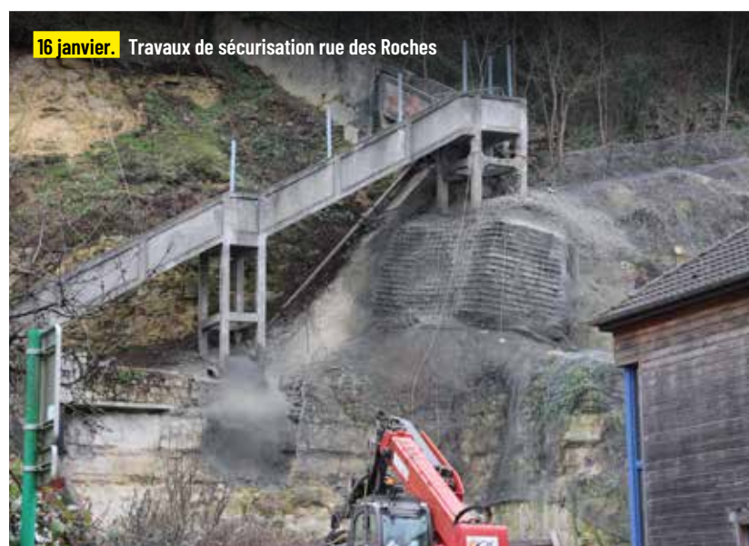
16 janvier. Travaux de sécurisation rue des Roches