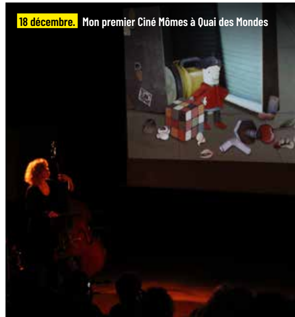
18 décembre. Mon premier Ciné Mômes à Quai des Mondes