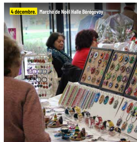
4 décembre. Marché de Noël Halle Bérégovoy