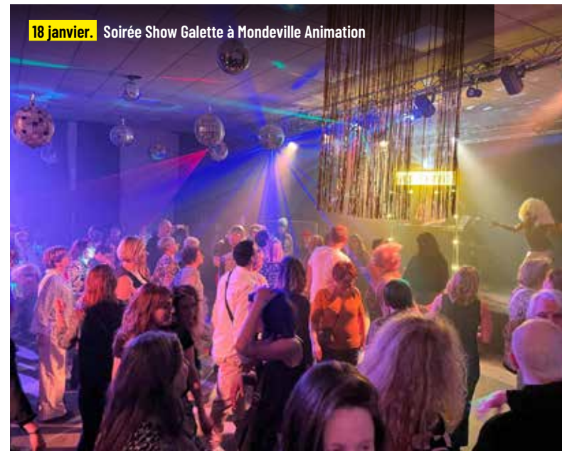
18 janvier. Soirée Show Galette à Mondeville Animation