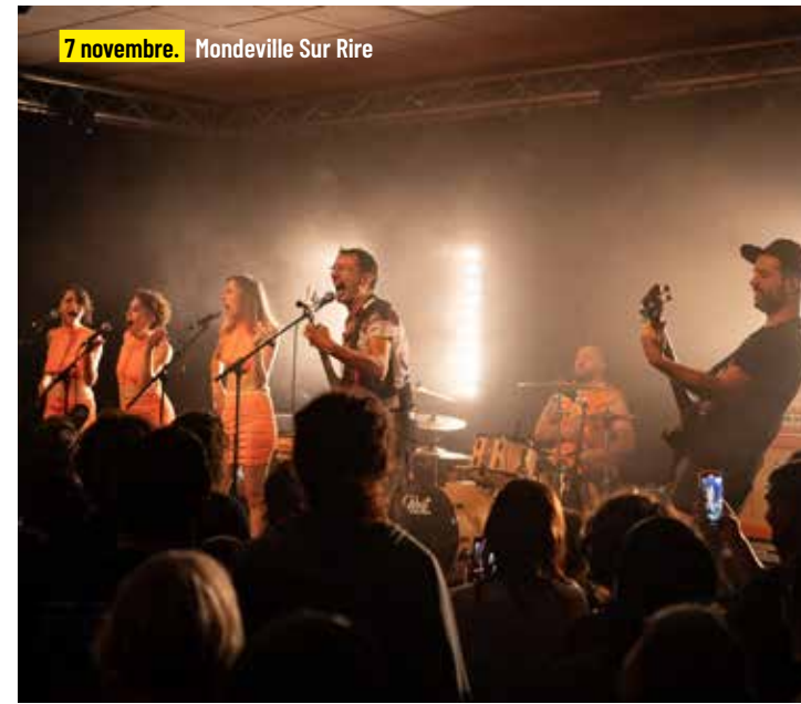
7 novembre. Mondeville Sur Rire