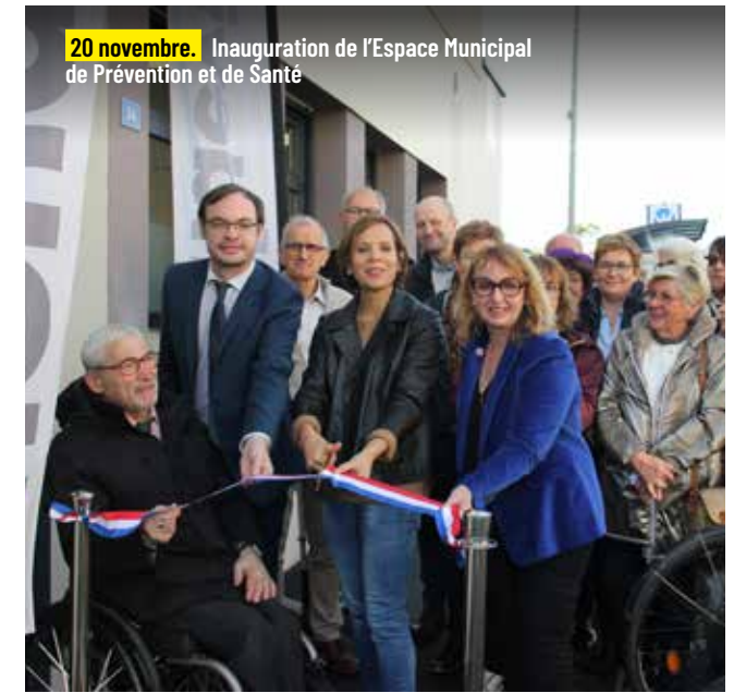
20 novembre. Inauguration de l'Espace Municipal de Prévention et de Santé