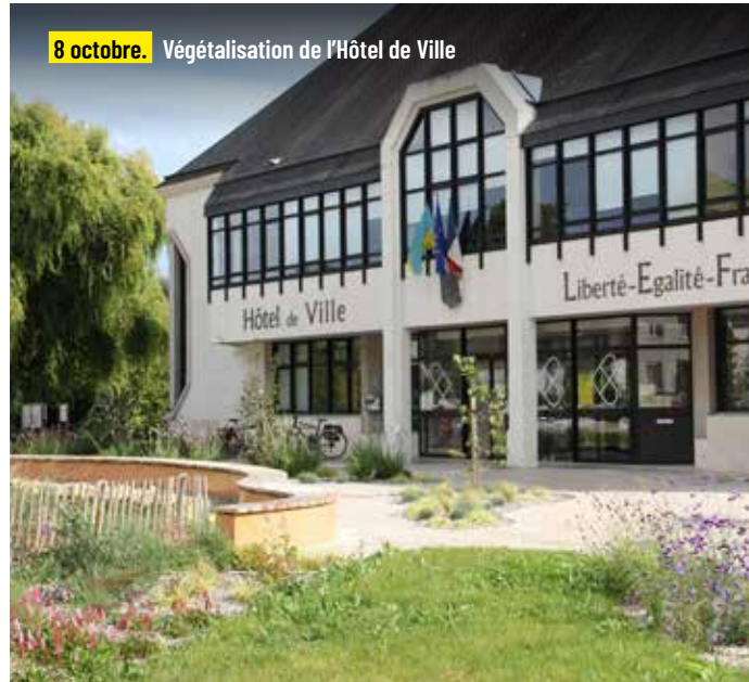
8 octobre. Végétalisation de l'Hôtel de Ville