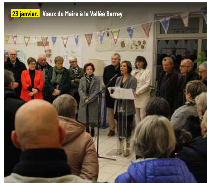
23 janvier. Vœux du Maire à la Vallée Barrey