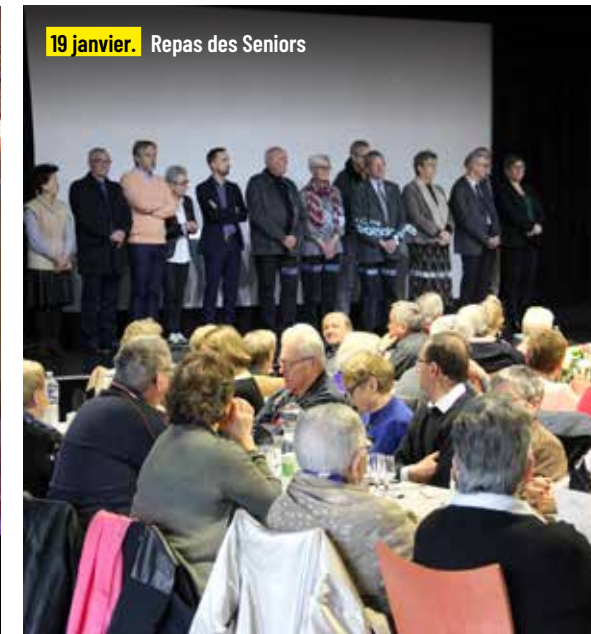
19 janvier. Repas des Seniors